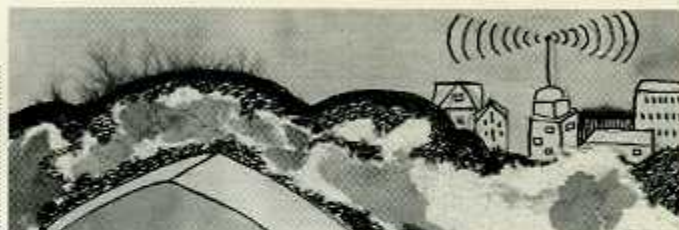
BEATRIZ STELLINO: SIN TÍTULO (DETALLE), TINTA/PAPEL, 2005