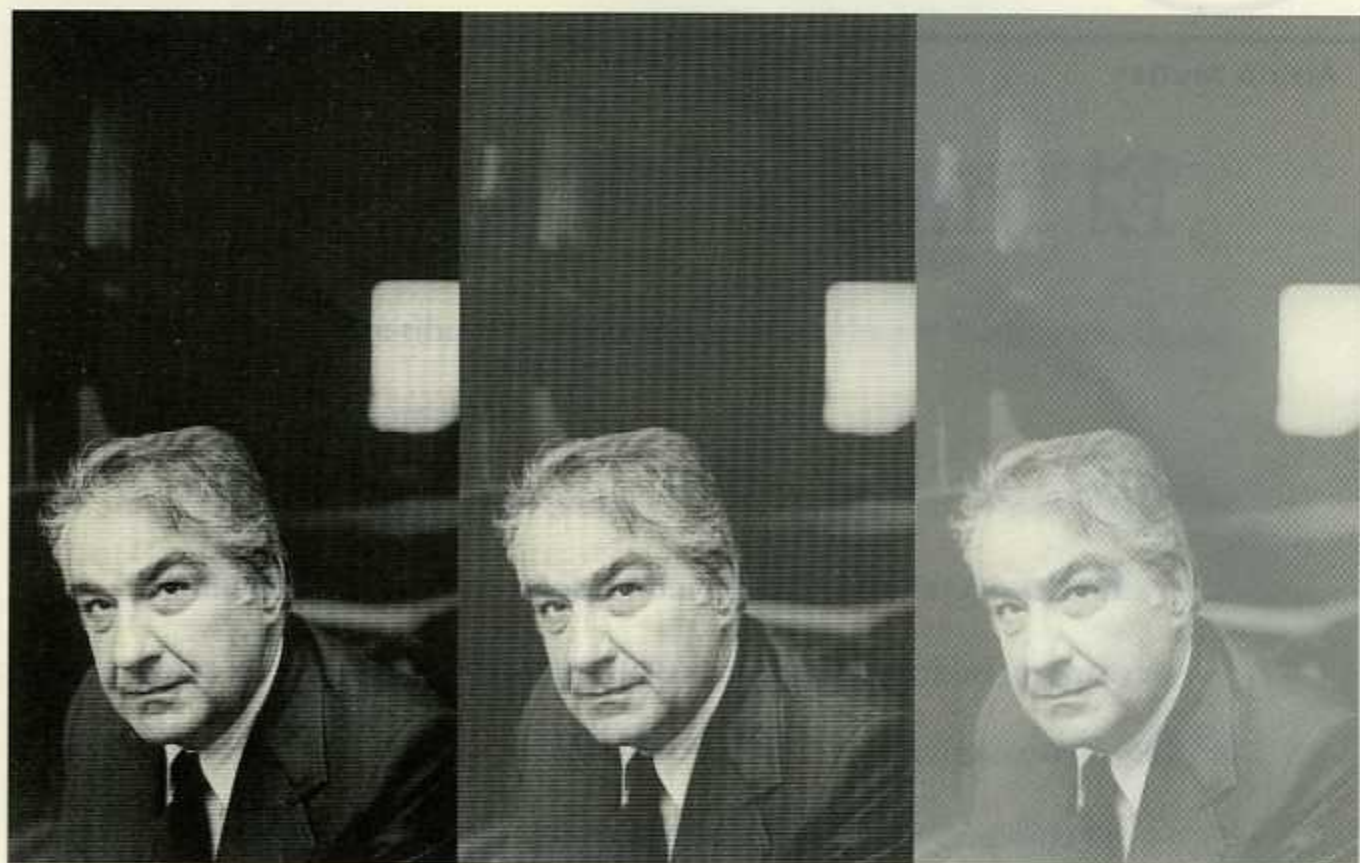
ÁLVARO MUTIS. CONACULTA-INBA-CIBPL.

ser, y al día siguiente los recuperó del cajón de la basura: "Algo me dijo que en esas líneas había ciertos elementos que eran totalmente míos, y ya no, simplemente, el eco de las voces literarias que me acompañaban desde niño [...] Allí estaba todavía esa primera página que decidí conservar, en la cual quedaron escritas muchas imágenes que después habrían de aparecer en mis poemas. Recuerdo una: 'Un dios olvidado mira crecer la hierba'..." 2